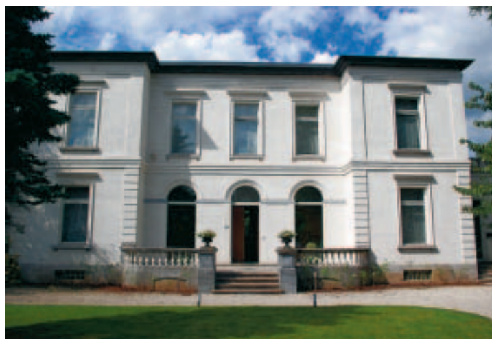
La ruine du XIXe siècle a fait peau neuve. ■ G.C.